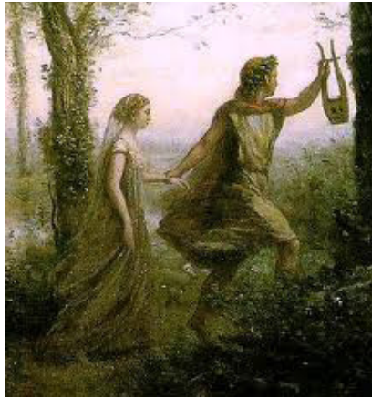
Euridice et Orphée

Pythagore, ce grand savant et philosophe et le célèbre Platon, acceptent l'idée que la vie ne s'achève pas par la mort ! Platon (427-347 av. J. C.) l'énonce ainsi dans son œuvre, Le Phédon :