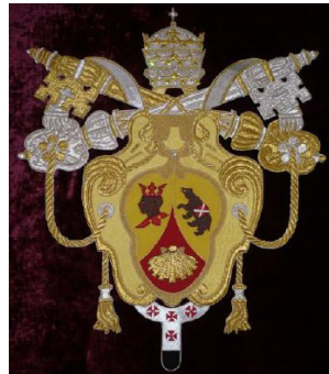
Blason de Benoît XVI

Si en Orient, au contraire, les âmes ne connaissent pas le chômage, puisqu'elles se réincarnent aussitôt dans un nouveau né homme ou animal, en Occident elles subissent un long sommeil, peut-être comparable à l'état de « dormition » attribué à la Vierge Marie jusqu'à son assomption céleste. Nous serions donc destinés, en tant que partie spirituelle de nous-mêmes, de nous retrouver après notre mort dans une espèce de « salle d'attente », jusqu'à la fin des temps pour subir le jugement dernier comme le prévoit le credo .