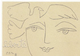
Le visage de la Paix