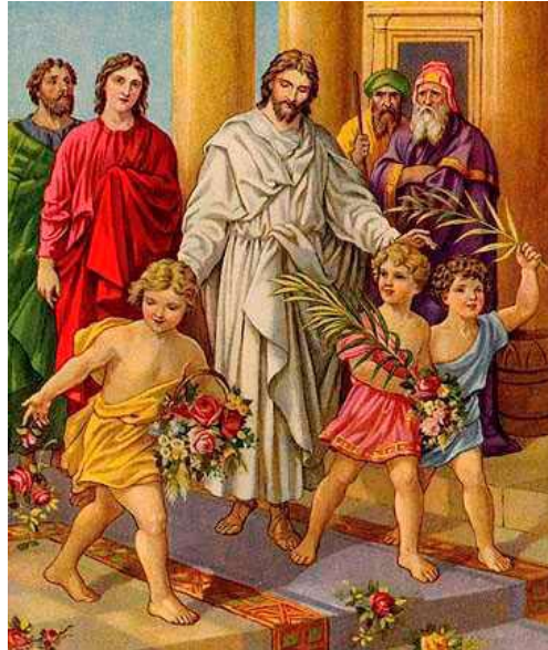
Jésus accueilli comme le Messie

Conforté par l'accueil délirant du peuple de Jérusalem et convaincu d'être appelé à être le nouveau roi, celui qui vient libérer son peuple du joug de l'occupant romain, il va provoquer le scandale au temple contre les échangeurs de monnaie.