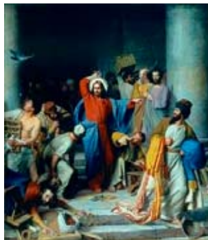
Jésus au temple

Ceux-ci acceptent les monnaies impures des idolâtres romains, grecs et autres, contre de la seule monnaie casher, les shekels, seuls aptes au paiement d'un animal de sacrifice.